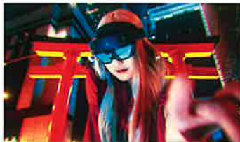
せきぐちあいみ (VRアーティスト)

1984年、「あなたと朝まで」でデビュー。2004年「干物女」と称して描いた恋愛コメディ「ホテルノヒカリ」が大ヒット。続編はるか主演でドラマ化・映画化。2024年、「西園寺さんは家事をしない」がTBSでドラマ化。