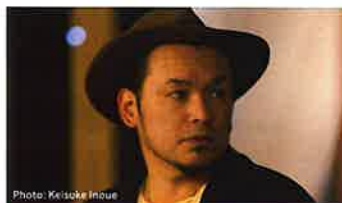
渡辺篤 (現代美術家・社会活動家)

2000年写真集「上海の流塵」で日本写真協会新人賞。2013年には写真集「対岸」(赤々舎)で木村伊兵衛写真賞受賞。また2017年河瀬直美監督作品「光」の撮影監督を務めるなど、映像作品も手がける。2024年万博記念公園ポスター「太陽の塔」で日本広告写真家協会アワード最高賞を受賞。