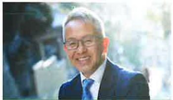
宮本亜門 (演出家・演劇アンバサダー)

宮本亜門氏がファシリテートする人主ドラマワークショップドキュメンタリー映像上映。