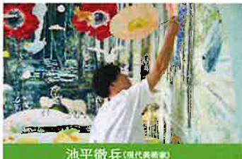
池平徹兵 (現代美術家)

東京藝術大学大学院修了。自身も経験者であるひきこもりや、孤独・孤立当事者たちとの共同企画を展開。横浜文化賞 文化・芸術奨励賞(2020)。主な展覧会に「あ、共感とかじゃなくて。」(東京都現代美術館、2023)など。