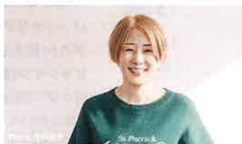
ひうらさとる (漫画家)

本名は前山田健一。京都大学を卒業後2007年に本格的な音楽活動を開始。アイドル、J-POPからアニソング、ゲーム音楽など多方面への楽曲提供。アーティスト、タレントとしても活動。 ※VOCALOID(ボカロ)は株式会社コトリンゴが株式会社コトリンゴの登録商標です。