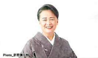
夏井いつき (俳句イロウチの俳句大賞) 審査員)

2016年からVR空間に3Dの絵を描くアーティストとして活動。アート制作やライブイベントオファーを世界各国から受ける。ヴェネチア国際映画祭のVR部門。2021年「Forbes Japan 100」に選出される。