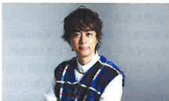
ヒヤダイン (音楽クリエイター)