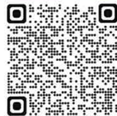
申し込み2次元バーコード